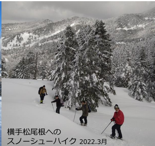
横手松尾根への スノーシューハイク 2022.3月