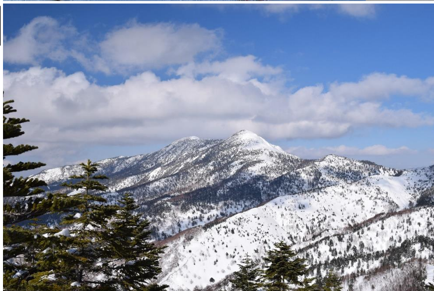
志賀盟主 岩菅山、 寺子屋リフトから 2020.3月