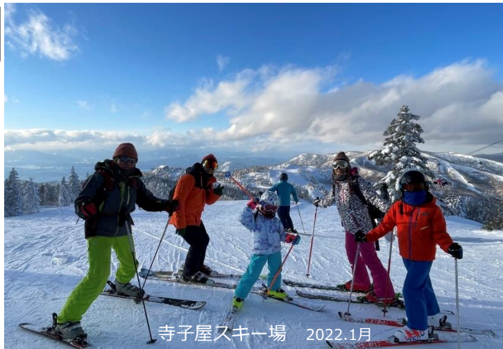
寺子屋スキー場 2022.1月