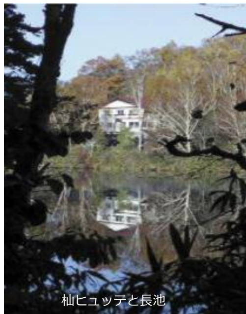
杉ヒュッテと長池