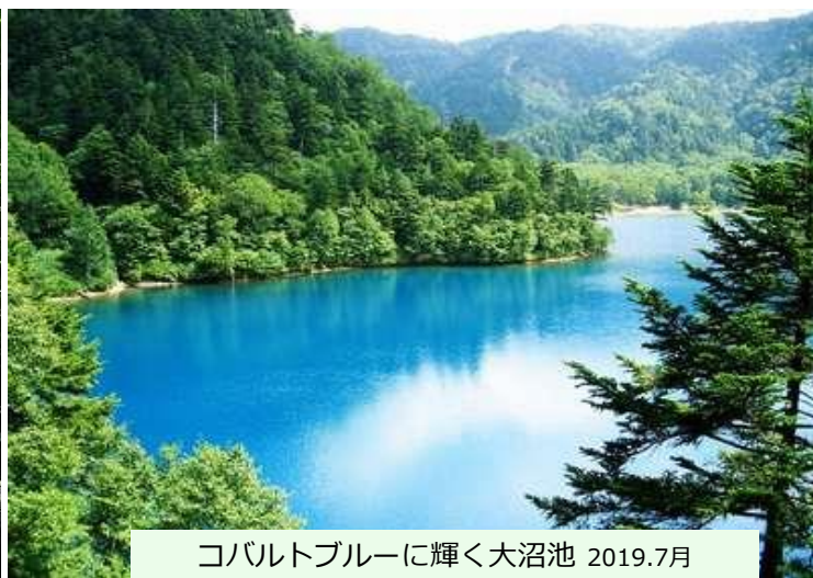
コバルトブルーに輝く大沼池 2019.7月

■ 自然を遊ぶ楽しむ : 美しい自然がいつでも四季折々にあります。2022GWは志賀はすごい残雪、熊の湯、横手、渋峠、滑れます。夏には、池巡りハイク、やさしい沢登り(人数限定、ガイドします)、今年は企画を多数用意します。秋はキノコです。